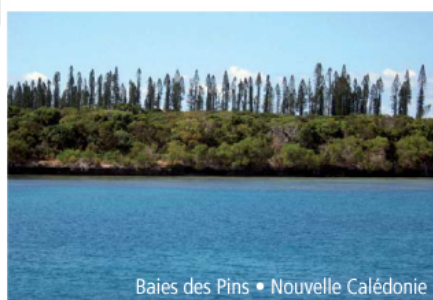
Baies des Pins • Nouvelle Calédonie