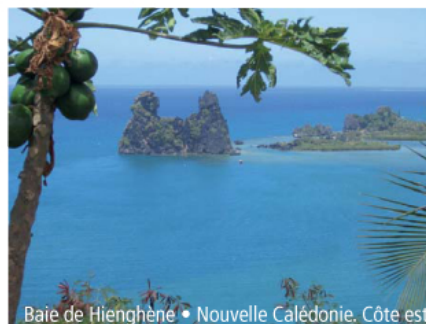
Baie de Hienghène • Nouvelle Calédonie. Côte est

Les enfants n'ont pas cessé de s'émerveiller devant ces prises de vue spectaculaires.