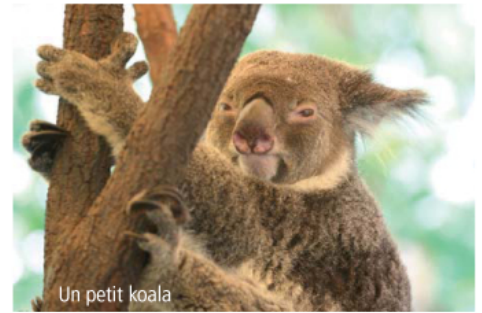
Un petit koala

Merci pour toutes ces magnifiques images d'animaux, on va en faire une affiche. On a surtout aimé les perroquets, qu'ils sont beaux !