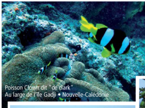
Poisson Clown dit "de clark" Au large de l'île Gadji • Nouvelle-Calédonie