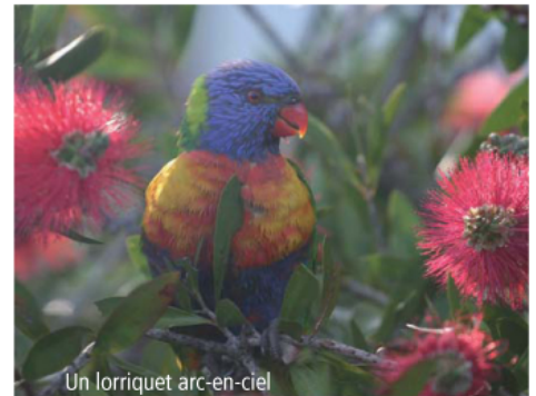
Un loriquet arc-en-ciel